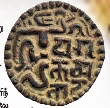
பிற்கால புராஶ்ரமபாஹு மன்னர்களின் நாணயம்

இங்கு தேவநாகர்யில் மன்னனின் பெயர் பொறிக்கப்பட்டுள்ளது போன்று ஏனைய மன்னர்களும் தத்தமது பெயர்களைப் பொறித்து நாணயங்களை வெளியிட்டார்கள். 1 ஆம் புராஶ்ரமபாஹு வெளியிட்ட நாணயங்களுக்கும் பின்னர் வந்த புராஶ்ரமபாஹு மன்னர்கள் வெளியிட்ட நாணயங்களுக்கும் ஸ்ரீ எழுத்தானது வேறுபட்டுள்ளது. 1 ஆம் புராஶ்ரமபாஹு வின் நாணயத்தலே ஸ்ரீ எழுத்தின் இடது புறத்தலே கீழே இரண்டாக பீர்ந்தருக்கும் அமைப்பானது மற்றைய புராஶ்ரமபாஹு மன்னர்களின் நாணயங்களிலே வலது புறத்தலே அமைந்திருப்பதோடு வீசர் போன்ற அமைப்பும் எழுத்தின் வலது புறத்தலே உள்ளது.