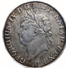
1821 ஆம் ஆண்டு 4 ஆம் ஜோர்ஜ் மன்னன் வெளியிட்ட வெள்ளி நாணயங்கள். எண்ணிக்கையில் 400 000 வெளியிடப்பட்ட இந்த நாணயங்கள் கடைப்பிடிக்காமலே