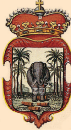
புலம் - 2