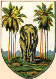
புலம் - 1

பிரித்தானியருக்கு முன்னர் இலங்கையை ஆண்ட ஒல்லாந்தர்களும் இலங்கைக்குரிய சின்னமாக தென்னை மரத்தோப்பிலே கறுவா மரக்கட்டுக்களைத் தூக்கச்செல்லும் யானையைக் கொண்டுள்ளார்கள். ஒல்லாந்தர்களுக்கு முன்னர் இலங்கையை ஆண்ட போர்த்தக்கீசரும் தென்னைமரத்தோப்பிலே நிற்கும் யானையைக் காட்டியுள்ளார்கள்.