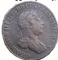
3 ஆம் ஜோர்ஜ் மன்னனின் உருவம்

பிரித்தானிய 3 ஆம் ஜோர்ஜ் மன்னனின் காலத்திலே இலங்கையிலே சீலான் என்னும் பெயருடன் வெளியிடப்பட்ட நாணயங்களில் சில. 2 Stuiver = 17.1 grams 1 Stuiver = 8.5 grams 1/2 Stuiver = 4.3 grams பிரித்தானியர் வெளியிட்ட நாணயங்களிலும் பெறுமத்க்கும் நிறைக்குமான வீக்தாசாரம் பேணப்பட்டுள்ளதைக் காணலாம்