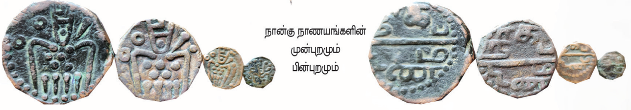
நான்கு நாணயங்களின் முன்புறமும் பின்புறமும்

போர்த்தக்கீசர்களால் வெளியிடப்பட்ட நாகபட்டின நாணயத்தின் முன்புறத்திலே ஒரு மனித உருவ அமைப்பு உள்ளது. இந்த அமைப்பானது பெண் கார் - தூர்க்கை தெய்வத்தைக் குறிக்கின்றது. காரியின் இடதுபுறத் தோளிலே செல்வத்தைக் குறிக்கும் ஷீப்கா என்கின்ற ஆயுதம் உள்ளது. ஒரு புள்ளியும், புள்ளியுடன் கூடிய கோலுமாக இந்த ஷீப்கா காட்டப்பட்டுள்ளது. மார்பகங்களுக்கு கீழே மூன்றும் இரண்டு மாக 5 புள்ளிகளும் கீழே நான்கு கால்கள் போன்ற அமைப்பும் உள்ளன. இந்த அமைப்பை தஞ்சாவூர் கார் - தூர்க்கை தெய்வமாக ஆய்வாளர்கள் கருதுவார். இலங்கை நாட்டின் பயன்பாட்டுக்காக வெளியிடப்பட்ட இந்த நாணயங்கள் முறையே Doit மற்றும் Stiver ஆகிய போர்த்தக்கீச பண அளவுகளைக் கொண்டவையாக அமைந்துள்ளன. இந்த நான்கு நாணயங்களிலே 3.80 கிராம் கொண்ட நாணயத்தைத் தவிர்த்த பிற மூன்று நாணயங்களும் கடைப்பதற்கு மிகமிக அரியனவாகும். நான்கு நாணயங்களை தற்காலத்திலே ஒருமீத்துக் காண்பது என்பது முயற்கொம்பான காரியமாகும்.