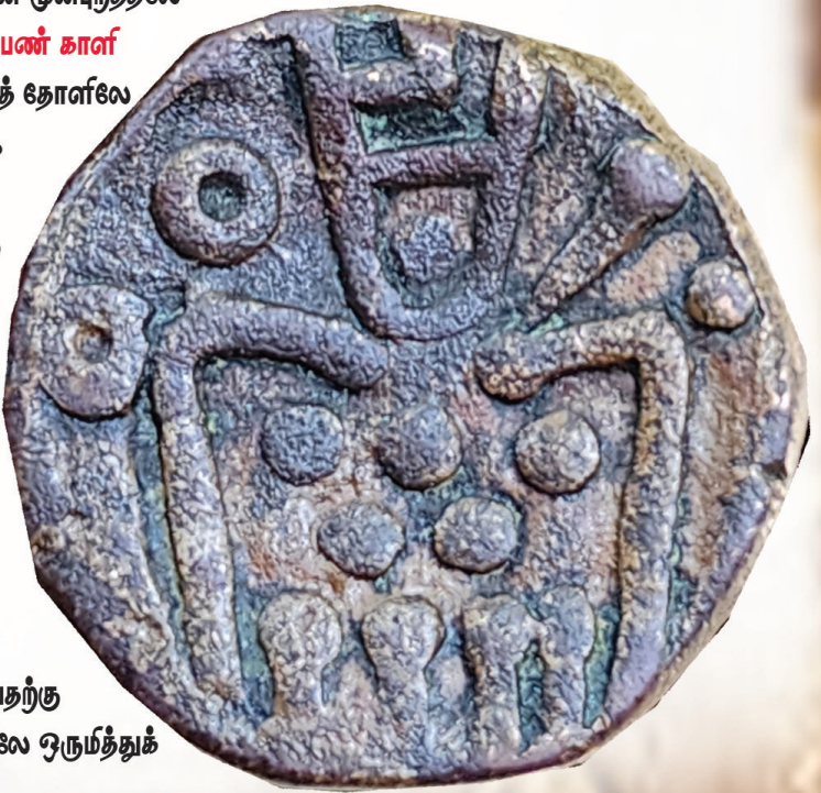
(குறிப்பு : இக்கட்டுரையில் காட்டப்பட்ட நாணயங்கள் யாவும் ஆசிரியரின் தனிப்பட்ட சேகரிப்பிலிருந்து)

போர்த்தக்கீசர்களால் வெளியிடப்பட்ட நாகபட்டின நாணயத்தின் முன்புறத்திலே ஒரு மனித உருவ அமைப்பு உள்ளது. இந்த அமைப்பானது பெண் கார் - தூர்க்கை தெய்வத்தைக் குறிக்கின்றது. காரியின் இடதுபுறத் தோளிலே செல்வத்தைக் குறிக்கும் ஷீப்கா என்கின்ற ஆயுதம் உள்ளது. ஒரு புள்ளியும், புள்ளியுடன் கூடிய கோலுமாக இந்த ஷீப்கா காட்டப்பட்டுள்ளது. மார்பகங்களுக்கு கீழே மூன்றும் இரண்டு மாக 5 புள்ளிகளும் கீழே நான்கு கால்கள் போன்ற அமைப்பும் உள்ளன. இந்த அமைப்பை தஞ்சாவூர் கார் - தூர்க்கை தெய்வமாக ஆய்வாளர்கள் கருதுவார். இலங்கை நாட்டின் பயன்பாட்டுக்காக வெளியிடப்பட்ட இந்த நாணயங்கள் முறையே Doit மற்றும் Stiver ஆகிய போர்த்தக்கீச பண அளவுகளைக் கொண்டவையாக அமைந்துள்ளன. இந்த நான்கு நாணயங்களிலே 3.80 கிராம் கொண்ட நாணயத்தைத் தவிர்த்த பிற மூன்று நாணயங்களும் கடைப்பதற்கு மிகமிக அரியனவாகும். நான்கு நாணயங்களை தற்காலத்திலே ஒருமீத்துக் காண்பது என்பது முயற்கொம்பான காரியமாகும்.