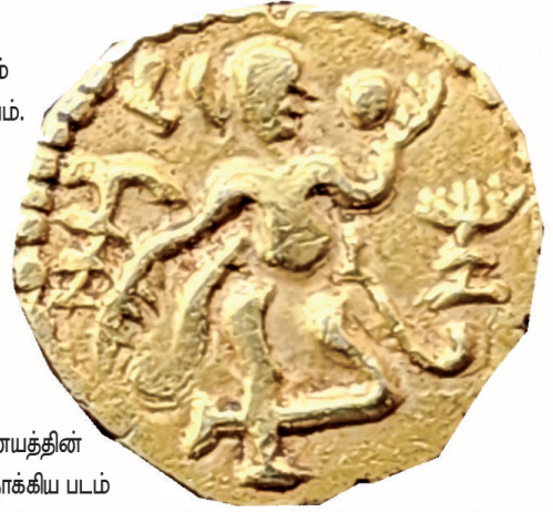
கால் களஞ்சு - லக்ஷ்மி நாணயத்தின் பெரிதாகிய படம்

இது பக்கத்திலே ஒரு களஞ்சு நாணயம் வலது பக்கத்திலே கால் களஞ்சு நாணயம். நாணயங்களின் இருபுறங்களும் காட்டப்பட்டுள்ளன. ஒரு களஞ்சு நாணயத்திலே லங்காவிபு என்றும் கால் களஞ்சு நாணயத்திலே லக்ஷ்மி என்றும் தேவநாகரியில் பொறிக்கப்பெற்றுள்ளன.