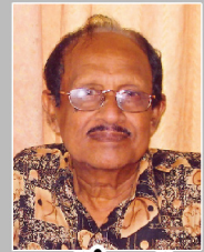
தமிழ்மணி மானா மர்கீன்