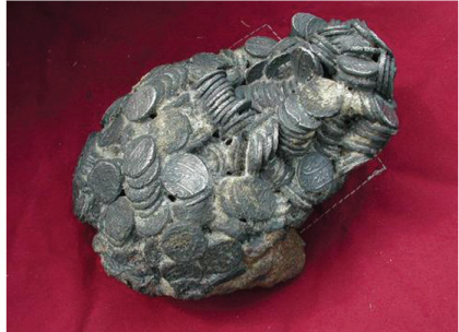
கிளார்க் கண்டெடுத்த சறாட் நாணய மூடைகளில் ஒன்று

மேலும் இந்த நாணயங்களிலே 'ஒன்றும் நல்ல ஒளரங்கசீப் ஆலம்கீர் போன்று உலகம் முழுதும் பணத்தை வெளியீட்டார்' என்தும் கருத்தைக் கொண்ட வாசகம் அராய்ய மொழியிலே பொறிக் கப்பட்டுள்ளதைக் காணலாம். இந்தியாவின் தென் தம்முகம் மற்றும் இலங்கை தவிரந்த இந்திய உபகண்டம் முழுவதையும் ஒளரங்கசீப் 49 ஆண்டுகள் ஆட்சி செய்தான் என்பது கவனத்துக்குரியது.