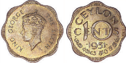
மலர் வடிவத்தில் அமைந்த பத்து சத நிக்கல்-பித்தளை நாணயம்.